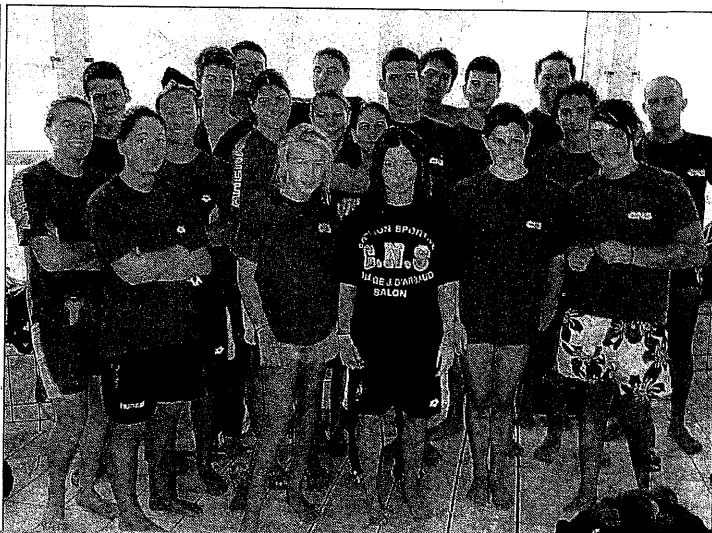
► Les filles de Berre ont terminé 3 e du niveau départemental et les deux équipes salonaises se maintiennent en régional.

L es piscines de Berre, Fos et Istres ont connu une grosse affluence ce week-end pour les interclubs départementaux et régionaux. Dans l'ensemble, les clubs de la zone ont atteint leurs objectifs notamment de maintien des équipes régionales même si les résultats ne sont pas officiels.